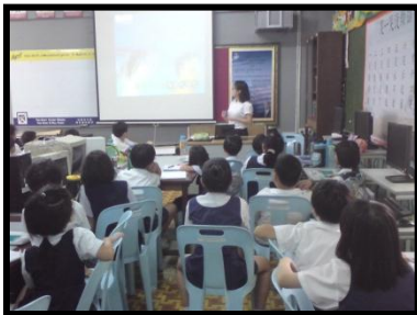
图3.1：学生专心在观赏录像带